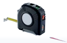
ФУНКЦИОНАЛЬНАЯ ОККЛЮЗИЯ В ЭСТЕТИЧЕСКОЙ СТОМАТОЛОГИИ