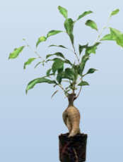
ГАРАНТИРОВАННЫЙ УСПЕХ В ИМПЛАНТОЛОГИИ