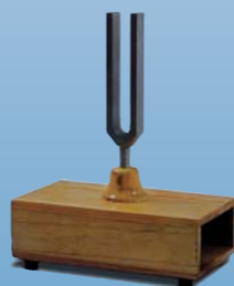
ТЕХНИКА РАБОТЫ С ДИАГНОСТИЧЕСКОЙ СИСТЕМОЙ К7

Об этих и других курсах программы Вы можете узнать здесь +7 (495) 644.4961 | +7 (495) 644.4962 | +7 (926) 747.9118 ze@dental-spa.ru | www.dental-spa.ru Москва, Мичуринский проспект, дом 7, корпус 1