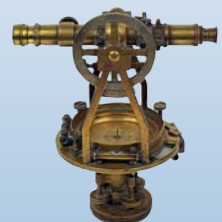
РЕНТГЕНОГРАФИЧЕСКОЕ ОБСЛЕДОВАНИЕ В СТОМАТОЛОГИИ