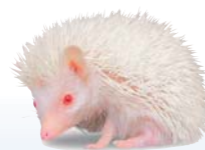
ОТБЕЛИВАНИЕ В СТОМАТОЛОГИИ