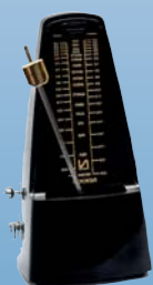
ДИАГНОСТИКА ОККЛЮЗИОННОЙ ДИСГАРМОНИИ (ИНТЕРПРЕТАЦИЯ СКЕНОВ К7)