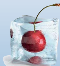
ОРТОДОНТИЧЕСКОЕ ЛЕЧЕНИЕ ВЗРОСЛЫХ ПРОЗРАЧНЫМИ КАППАМИ