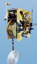
НЕЙРОМЫШЕЧНАЯ ФУНКЦИОНАЛЬНАЯ ОРТОДОНТИЯ